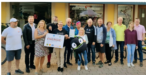
Bruck ist mobil, das ist Sinn und Zweck dieser Woche, und es muss nicht immer mit dem Pkw sein!

Ebenso gab es Infostände der Radlobby und des Radlandes NÖ. Das bunte Programm für die Kinder fand gut Anklang, die Hüpfburg war stark frequentiert, die Kinderpolizei wurde alles Mögliche und Unmögliche gefragt.