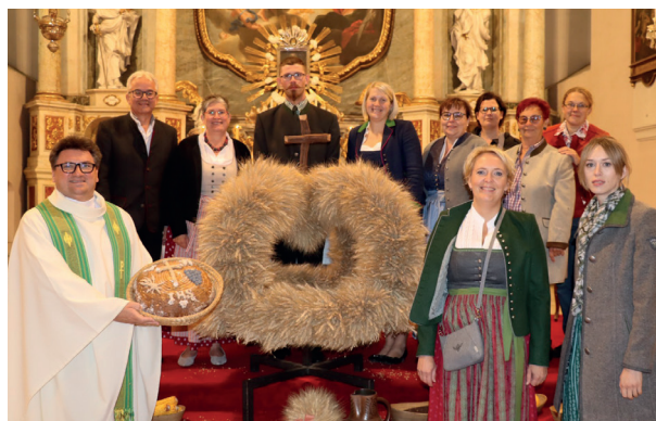
Zusammenkunft und Dankbarkeit: Brucker Bauern feiern das Erntedankfest mit Freude und Gemeinschaft

Gemeinsam mit der Erntedankkrone zogen bei der Erntedankmesse die Bäuerinnen und Bauern in die Kirche ein. Wir danken Pater Erich für die feierliche Messe, welche jedes Jahr von der