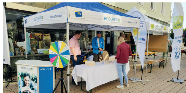
Danke an alle Teilnehmer und Freiwilligen für die gelungene Mobilitätswoche 2023!